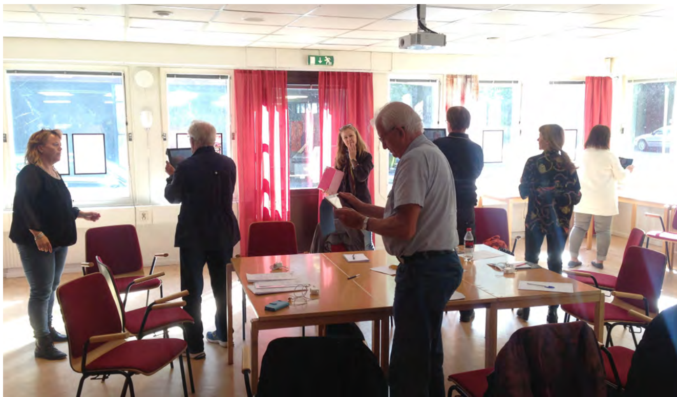
Ett kurstillfälle med nybörjare på Mötesplatsen där deltagarna går runt och fotograferar eller filmar. På bilden syns även personal som arbetar där.