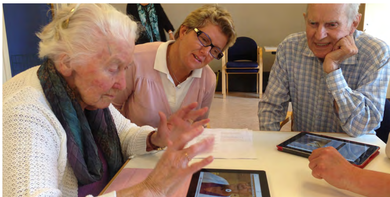
Ett kurstillfälle med den äldsta gruppen deltagare i projektet som brukar träffas på Framnäsågårdens träffpunkt. På bilden syns även personal som arbetar på träffpunkterna i stadsdelen.

Lärorikt och gav också ett nytt socialt sammanhang. Sen jag blev pensionär har jag varit aktiv och gjort olika saker. Tycker det är roligt. (kvinna, 71 år)