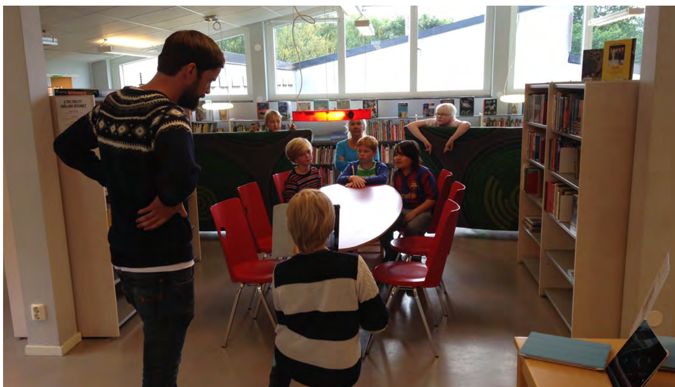
Ett kurstillfälle med barnen som gick i årskurs 5. Platsen är på Guldhedens bibliotek. En av projektets personal och fritidspedagogen är med på bild.

Det var relativt sett fler barn och unga som upplevde att projektet hade bidragit till kunskaper om filmning (7 av 8 barn/unga) jämfört med bland de äldre (8 av 12 äldre). En annan skillnad var att en större andel barn och ungdomar svarade att projektet hade gett dem en känsla av